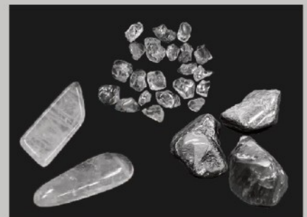
天然石プチストーン

クイズラリーに参加して正解すると、日替わりで天然石プチストーンをプレゼント! ※数量限定