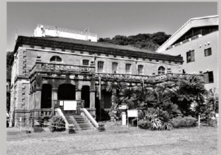
溶結凝灰岩(建物の外壁)

展示解説に合わせて、希望者には博物館周辺で見られる石材を実際に歩いて解説します。※雨天時は館内解説のみ