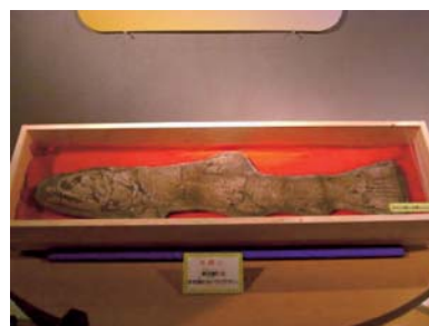
魚類化石「カラモプレウルス」(本館2階・自然総合展示室)