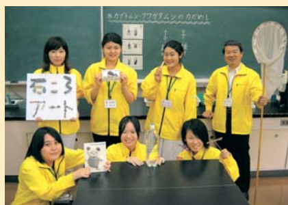
私たちと一緒に楽しみませんか