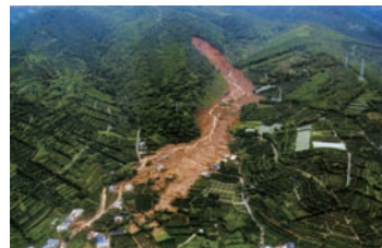
針原地区土石流災害

この企画展では、鹿児島で発生する自然災害の原因やこれらの災害から身を守るために普段からどのような対策をしておけばよいか紹介します。