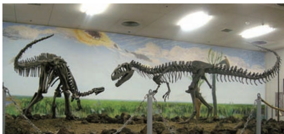
カンプトサウルス(左)とアロサウルス(右)

これらの恐竜は約1億5000万年前(後期ジュラ紀)の北アメリカ、ユタ州のモリソン