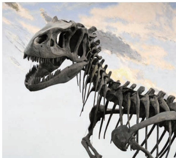
アロサウルスの頭部 歯が恐ろしい…

みなさん、2体の恐竜のあご、歯、爪、骨盤の形などを比較してみてください。その違いにきっと驚くと思います。