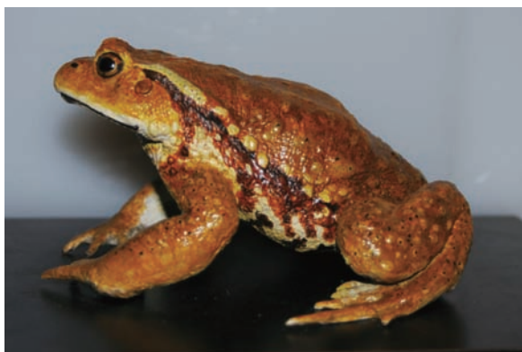
ニホンヒキガエル (レプリカ)