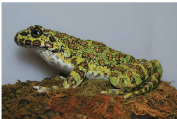
アマミシカワガエル (レプリカ)