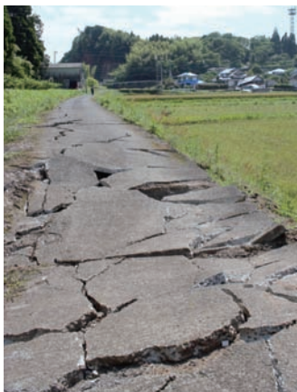
亀裂の入った道路

今年の4月、一連の大きな地震が熊本県を襲いました。これらの地震の最大震度は、気象庁震度階級で最も大きい震度7を観測しています。鹿児島県内でもこの地震の揺れを感じ、恐怖を感じた人も多かったのではないのでしょうか。