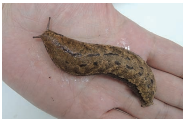
手のひらを這うヤマナメクジ

特に苦労したのがヤマナメクジで、「1匹では見栄えがしないから10匹位採ってこい！」とY主任学芸主事から無理難題を言われ、深夜の森に何度も探しに行きました。