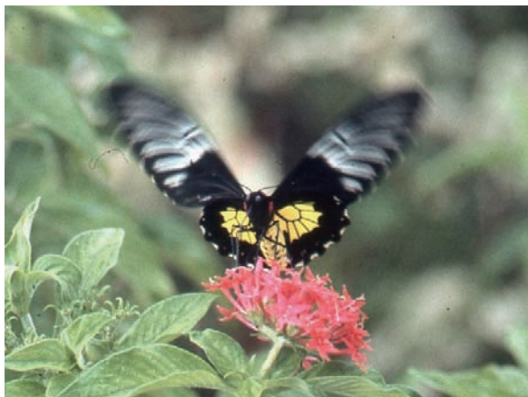
フィリピンキシタアゲハ

当館は約15万点の標本を収蔵していますが、それらを皆さんに紹介するのが蔵出し博物館です。2016年12月17日(土)から2017年3月