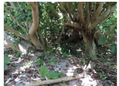
沖永良部島のハスノハギリ