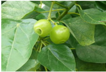
ハスノハギリの葉と実

ハスノハギリの葉は厚くて丈夫です。葉は互い違いにつき、直径は10～30cmと子供の傘になりそうなほど大きく、葉の付き方が「ハスの葉」状になることが和名の由来になっています。