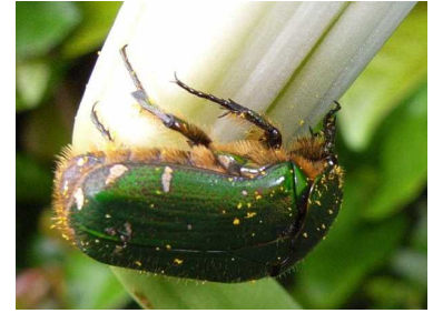
テッポウユリの根元から盗蜜するハナムグリ

サトイモ科のマムシグサなどでは、筒状の変った花を咲かせます。この筒の内側はツルツルと滑りやすく、昆虫が登って出ることができません。この花にはハエの仲間がやってきますが、雄花が咲いているときには下に穴が空いていて、花粉を身につけたハエが出て行けるようになっています。しかし、雌花にはこの穴がありません。ハエは狭い筒状の花の中を行ったり来たりしながらめしべ