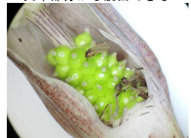
雌花の根元を切ったもの ハエの仲間が死んでいます

花粉をつけますが、花から出してはもらえないのです。確実に受粉できるように、このような性質が進化したと考えられます。