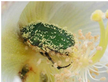
花粉まみれのハナムグリ

ハナムグリの仲間は、花にやってきて蜜もなめますが花粉も食べてしまいます。もし花が用意する花粉が少ないと食べ尽くされ、花にとっては蜜も花粉も取られ損になってしまいます。この場合には、食べられてもそれを上回る大量の花粉を用意する方向に進化が進みます。より花粉を多く作ることができる個体が、より子孫を多く残せるようになるのです。