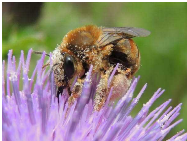
後足に花粉をためるハナバチ

同じことが、ハナバチの仲間にも言えます。ミツバチやマルハナバチなどは、成虫のエサとしての蜜をおなかに入れて運び、巣に貯蔵します。それとは別に、花粉も運んで巣にため込み、幼虫を育てるときに利用します。蜜には炭水化物が豊富ですが、身体の骨組みを作るタンパク質が足りません。花粉にはタンパク質が豊富なのです。そのため、ハナバチの仲間には、後ろ足に花粉をためて運ぶポケットを発達させたものが見られます。からだに付着した花粉を前足できれいに集め、花粉ポケットにしまい込まれると、植物にとってやはり取られ損になります。