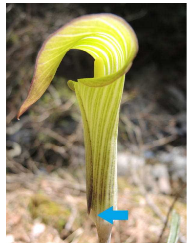
マムシグサの雄花 矢印部分から脱出できる