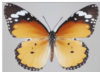
図5. カバマダラ(毒チョウ)