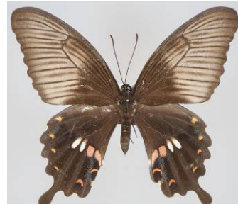
図4. シロオビアゲハ♀(無毒)