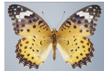
図7. ツマグロヒョウモン♀(無毒)