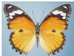
図6. メスアカムラサキ♀(無毒)