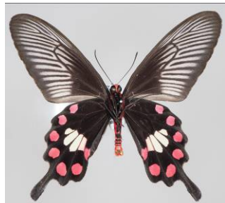
図3. ベニモンアゲハ(毒チョウ)