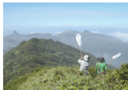
図5 山頂での吹き上げ採集