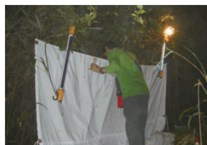
図3 灯火採集の様子