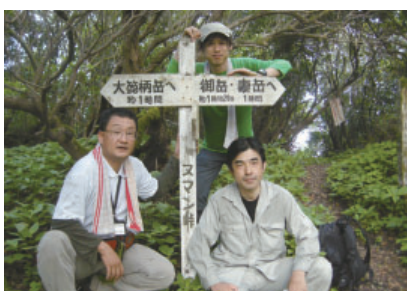
図2 スマン峠を登り切ったところ

中峯浩司(2004) 高隈山頂の蛾. Satsuma , 131:153-156.