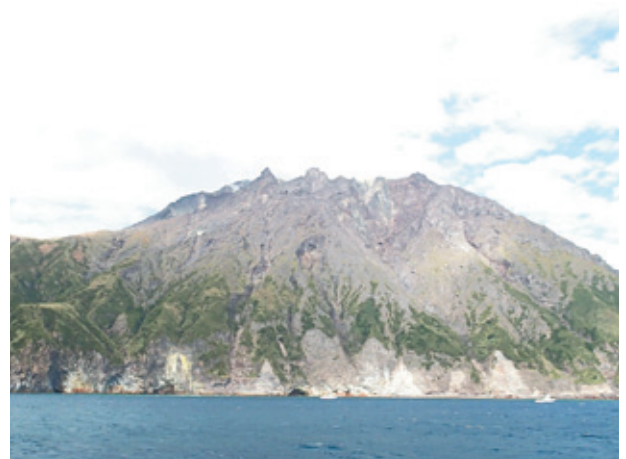
図7. 船上から見た硫黄岳

現在の竹島、硫黄島のチョウ相はどのようにして形成されてきたのか。これには(1)地質的側面(2)植物相の変化(3)ヒトによる攪乱(4)飛来するチョウと定着までの過程、以上4点が複雑に絡み合っていると思われる。