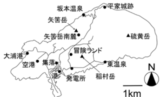
図1. 硫黄島調査地点