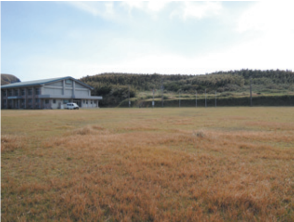
図5. みしまふれあい広場

集落から東風泊への道沿いは若い雑木林で, ところどころリュウキュウチクの群落もあった。路傍にはカラムシが少なからずあり, アカタテハの造巢も確認した。樹高4mほどのネムノキが1本あり, その周囲でキタキチョウを得ている。付近では, そのほかのマメ科植物は目につかなかった。