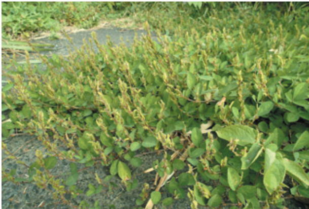
図3. 舗装道路まで広がるシバハギ群落