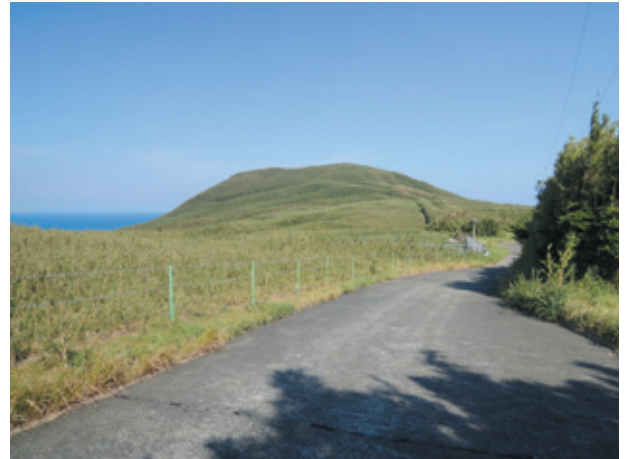
図6. 佐多浦牧場のリュウキュウチク群落

集落~佐多浦牧場の間も, リュウキュウチク群落と若い雑木林が混在した植生で, カラスザンショウの比較的大きな木が群生しているところもあった。ところどころにシバハギの群落もあったが, やはりタイワンツバメシジミは確認できなかった。シロノセンダングサはここで少数が見られただけであった。