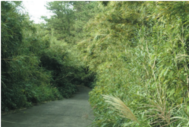
図2. 稲村岳南麓の道路と周辺の植生

入り口の重油タンク付近にはシバハギの大群落 (数m四方) があり、花盛りであったが、タイワンツバメシジミは成虫、幼生期、食痕とも発見できなかった。さらに進むと、路の周辺にはクロマツ、リュウキュウチクの他、イヌビワ、アカメガシワ、ムラサキシキブ (果実) が見られ、クサギ (花)、フジウツギ (花) には少数のツマグロヒョウモン、イチモンジセセリが訪花していた。カラスザンショウもあったが、思った