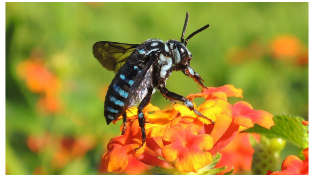
図2. ナミルリモンハナバチ (2012年9月28日本村にて撮影)

Parapolybia crocea Saito-Morooka, Nguyen & Kojima, 2015 1♀ 27. IX. 2012 湯向