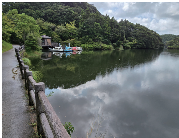
図2 西京ダム、ボート乗り場