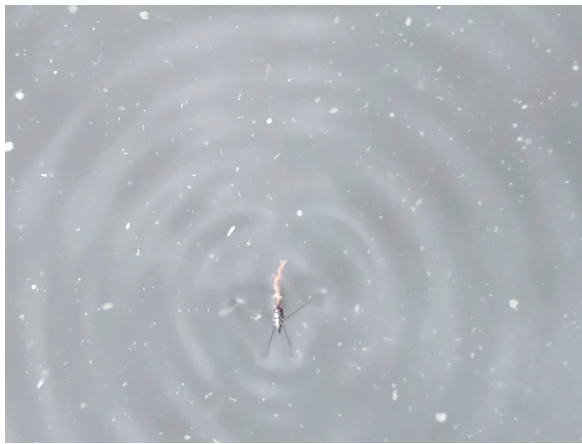
図5 木片を押しながら波紋を広げて♀を誘うトガリアメンボ♂