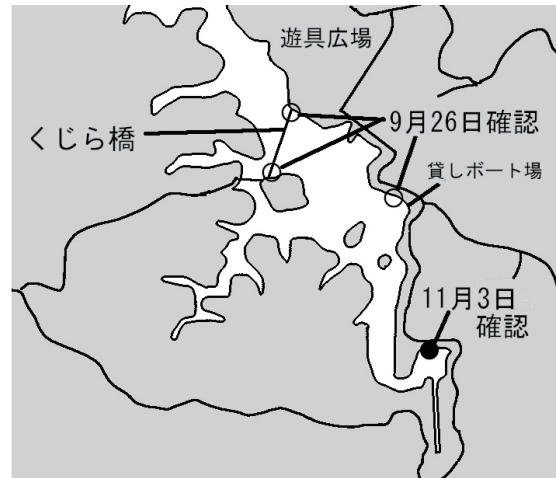
図6 西京ダムの調査地