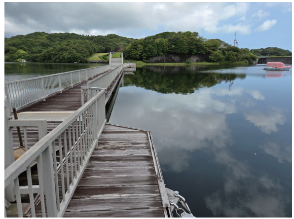
図4 くじら橋(9月26日、この後撤去された)