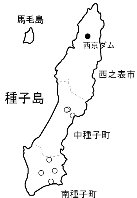
図7 種子島のトガリアメンボの分布(2025年) ● 2025年9月26日、最初の確認地(西京ダム) ○ 2025年9月26~27日の調査で見つからなかった池

・中種子町増田(ため池)、9月26日調査。本種は確認されなかった。近隣の池でも確認されず、この池ではナミアメンボが多数見られた。