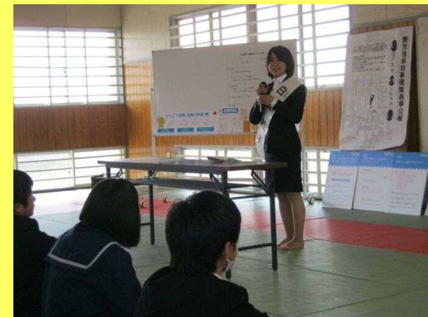
学生投票率100%をめざす会の大学生が立候補者役となった模擬選挙