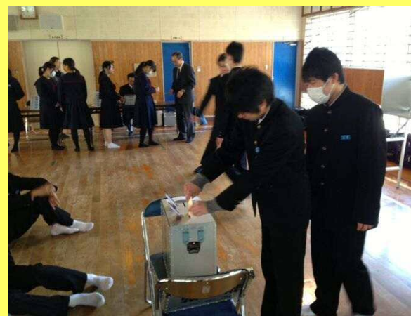
模擬投票では実際の投票用紙や投票箱を使用