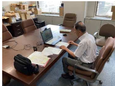
鹿屋市立串良小学校 選挙講話の様子

また、出前授業を実施している市町村もありますので、出前授業の実施を検討される際は、学校所在地の市町村選挙管理委員会にもお問い合わせいただけます。