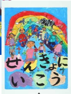
平成22年度ポスターコンクール文部科学大臣・総務大臣賞受賞作品(小学生の部)