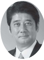
鹿児島県議会議員候補 自民党公認

7期目を目指して コロナ感染症に対する予防対策をとりながら健康で安心して暮らせる社会を実現します。そして高齢者の皆様がゆとりを持って暮らし、若者が愛情豊かに子育てができるよう福祉の向上に努めます。 また「稼げる農林水産業、商工業」の振興に取り組み「心豊かな故郷造り」につとめます。