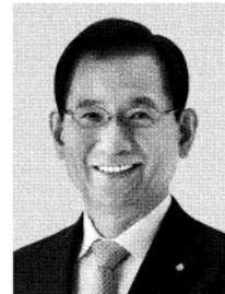
はまだ 浜田 まさよし 現 前復興副大臣。参院議員2期。 京都大学卒、59歳。 あなたの声、活かす力!