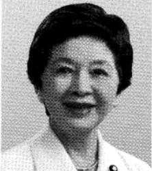
日本のこころ代表 中山 恭子 元拉致問題担当大臣