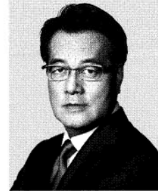
民進党代表 岡田 克也