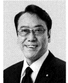
ながさき ひろあき 現 参院災害対策特別委員長。 参院議員1期。東洋大学卒、57歳。 庶民とともに。行く。