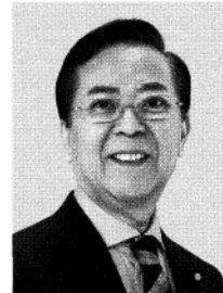
よこやま 信一 現 元農林水産大臣政務官。参院議員1期。 北海道大学大学院修士課程単位取得、56歳。 “地方創生”で未来を創る。 実現力の男。