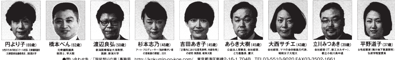
●問い合わせ先/「国民怒りの声」事務局 http://kokumin-no-koe.com/ 東京都港区新橋2-16-1 704B TEL03-5510-9020 FAX03-3502-1661