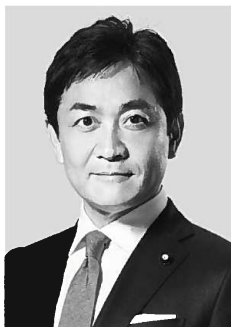
国民民主党 代表 玉木雄一郎