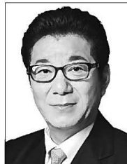
代表 松井 一郎