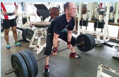
床上のバーベルを両手で腰まで持ち上げて直立するデッドリフト

バーベルを持ち上げ、その重さを競うパワーリフティング。スクワット・ベンチプレス・デッドリフトの3種目が、それぞれ3回の試技を行い、その合計重量で順位を競います。シンプルな競技だけに、筋力を鍛えることが何