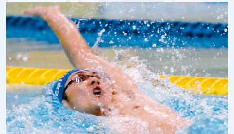
2006年の兵庫国体で見事優勝。翌年には連覇を達成した。(南日本新聞 2006年10月5日掲載)

けない。そのプロセスを小さい頃から経験してきたので、北京オリンピックに出場した際も自分の力を最大限に発揮できたと思います。」