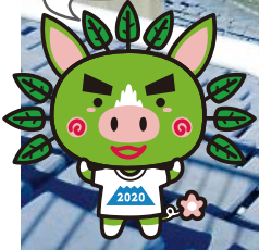
県立鴨池陸上競技場では、総合開会式・総合閉会式も開催されます。