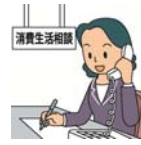
「消費者庁イラスト集より」

*消費者トラブルを未然に防止するため、 実際の相談事例や消費生活に役立つ情報 を掲載! 詳しくは、県HPをご確認ください。