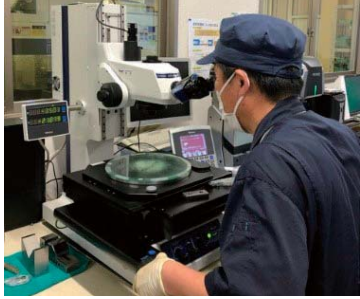
▲医師をサポートする手術支援ロボットの開発・製造を支援

新産業創出を促進するため、県内企業の研究開発や事業化及び事業の規模拡大への取り組みを支援