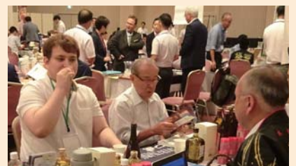
海外のバイヤーを招いた商談会 (H30.9 鹿児島市)