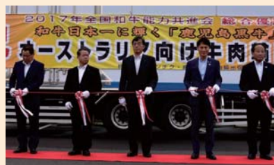
和牛日本一の「鹿児島黒牛」のオーストラリア向け輸出出発式 (H30.7 曾於市)