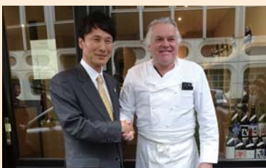
海外高級レストランでの県産品のトップセールス (H30.1 フランス・パリ)