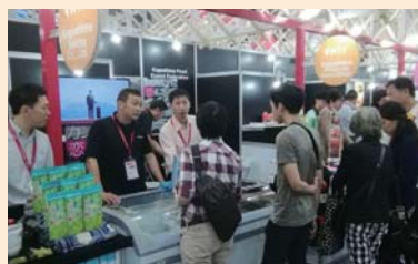
海外見本市での試食・試飲会 (H30.5 タイ・バンコク)