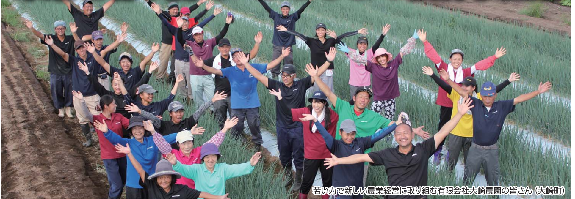
若い力で新しい農業経営に取り組む有限会社大崎農園の皆さん(大崎町)