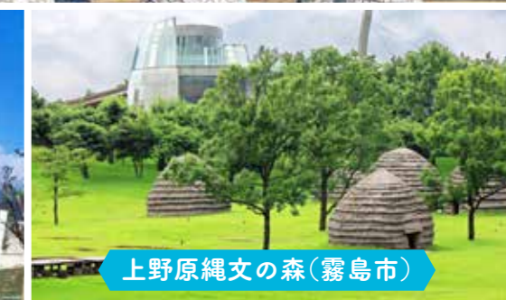
上野原縄文の森(霧島市)