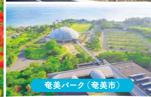
奄美パーク(奄美市)