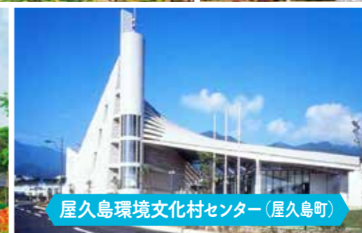
屋久島環境文化村センター(屋久島町)