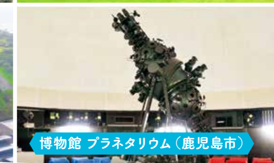
博物館 プラネタリウム(鹿児島市)