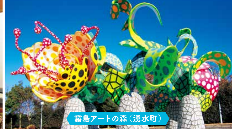
霧島アートの森(湧水町)