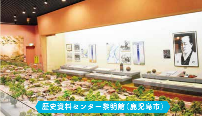
歴史資料センター黎明館(鹿児島市)