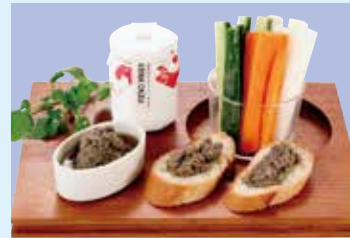
お土産 「漁師印のキビーニャカウダ」は、甑島の新鮮なきびなごを使ったバーニャカウダソース。さまざまな料理に合うのが特徴。

美しい銀色の体に鮮やかな青い帯模様が走っているきびなご。鹿児島県南部の方言で帯を「きび」、小魚を「なご」と呼ぶことからその名が付いたとも言われています。 鹿児島県は全国でも有数のきびなごの産地として知られており、主な産地は甑島をはじめ、北薩地区や南薩地区、熊毛地区など。年間を通じて水揚げされますが、特に5〜6月は産卵期で魚体が大きく、脂も乗っています。 酢味噌や生姜醤油で食べる刺身、天ぷらや唐揚げ、塩焼きなど、さまざまな食べ方で味わうことができます。きびなご料理は鹿児島県を代表する郷土料理として観光客にも人気です。