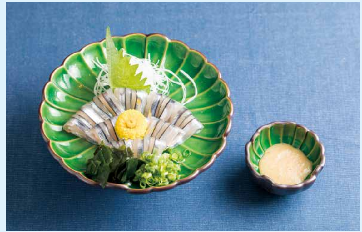
刺身 開いた身を菊の花のように並べた「菊花造り」。 酢味噌や生姜醤油で食べることが多い。