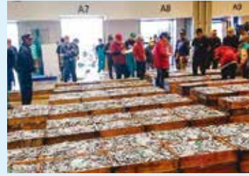
市場 鹿児島市中央卸売市場魚類市場で競りにかけられるきびなご。木箱がいっぱいに並ぶ様子は壮観。