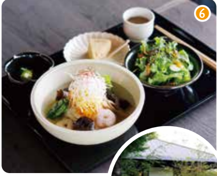
十五代こだわりの草木が植えられた四季折々の庭も、食事と共に楽しめる。