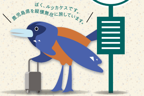
【ルリカケス】 奄美群島の一部にのみ生息する瑠璃色の体毛が美しい鳥。 鹿児島県の県鳥。国の天然記念物にも指定されている。

新しい生活様式が日常となった た。今、自宅から1〜2時間で行ける「近所旅行」マイクロツーリズムや仕事と休暇を掛け合わせた「ワーケーション」が注目されています。訪れたことのあるエリアでも、あらためて見渡してみれば、そこには新たな感動や再発見がきっとあるはず。自分に合う新しいスタイルの旅を探してみよう。