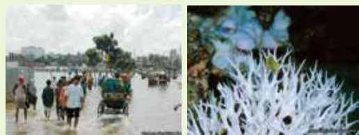
バングラデシュでの洪水被害(左)と白化したサンゴ(右)

温暖化が進むと、異常気象の増加や農作物の品質低下、生態系の変化など、さまざまな分野へ影響を与えると考えられています。