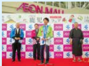
「鹿児島フェア」(愛知県)

鹿児島には、 自然環境、歴史・文化、農林水産物、どれを取っても一流の素材がたくさんあります。 鹿児島県一流の素材を国内外に積極的に売り込み、 県民の所得、生活を少しでもよくするため、 全力で取り組んでいます！