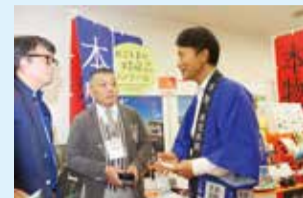
「南の逸品商談会 in Tokyo 2016」(東京都)

全国的な規模で事業展開している大手企業・事業者などを対象に、本県のブランド力が向上するよう、県産品の販売促進や観光客の誘致拡大、企業誘致などにつながる知事トップセールスを県下の経済団体などと一体となって展開。また、経済成長著しい中国、香港、シンガポールを中心に、本県の国際的な認知度アップを図るとともに、県産品の海外市場開拓や海外観光客の誘致などにつながる知事トップセールスを展開しています。