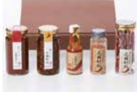
2016かごしまの新特産品コンクール 鹿児島県知事賞

明治から昭和初期には「世界の相場を作る」「世界の二大産地」と言われるほどの生産量と品質を誇っていた「花岡胡椒」を再興しました。2015年にはかごしまの伝統野菜に指定された花岡胡椒のギフトセットです。