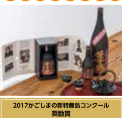
2017かごしまの新特産品コンクール 奨励賞