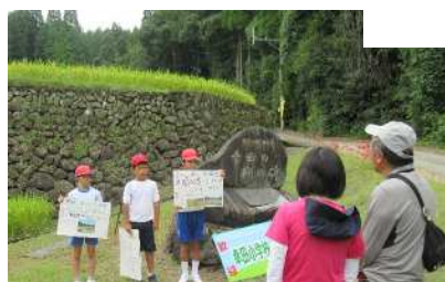
発表できるようになる！