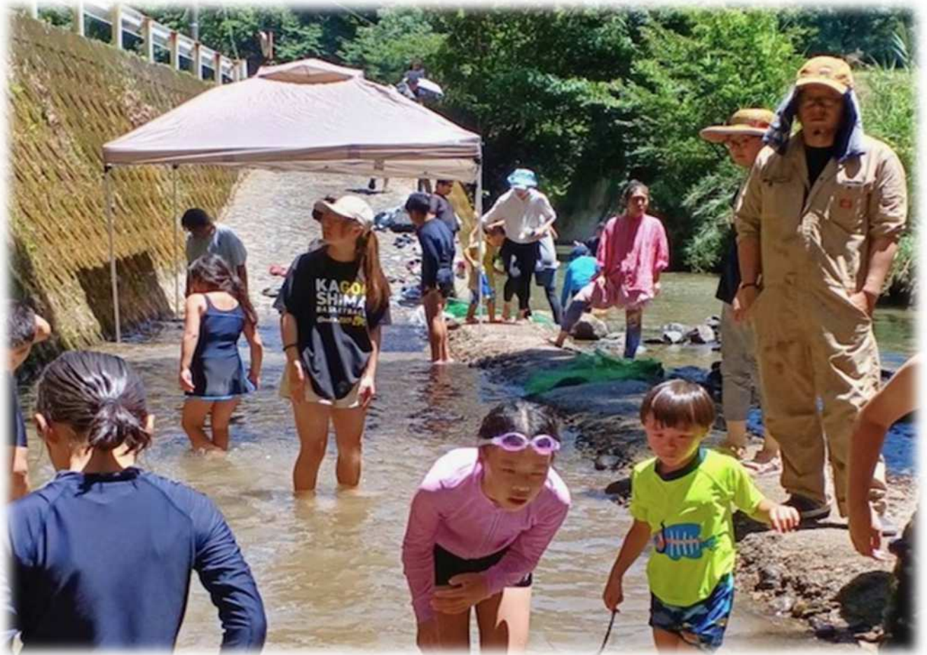
山村キャンプの様子(山村留学行事の一例)