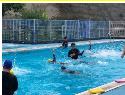
泳げるようになる！