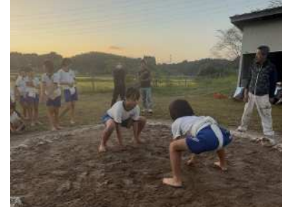
自分に自信をつける！