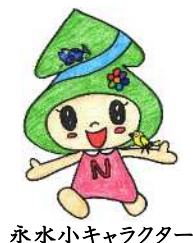
永水小キャラクター