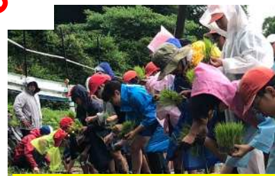
自然の中で学べる！