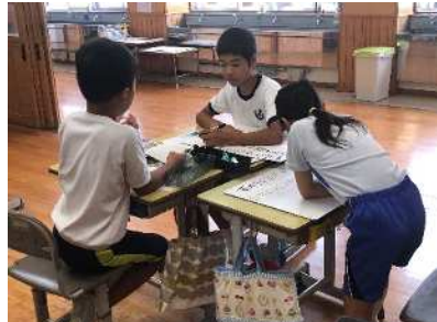
少人数で楽しく学べる！

できるできるっ きみならできるっ やるきがあれは ぜったいできる だめだ あもうあいだは できません まちがいなんか こわくないっ だかう いっほ ふみだせ ゆうきをだして