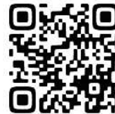
上城小学校ブログ