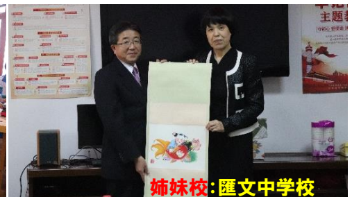
姉妹校: 匯文中学校