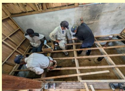
【空き家改修ワークショップ】