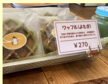
【地元農産物使用の加工品】